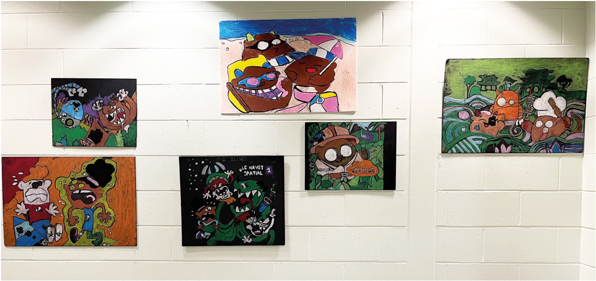
Quelques œuvres à l'École-sur-Mer. Merci aux responsables du Salon du livre de l'Île-du-Prince-Édouard de nous avoir fourni les photos. 📷