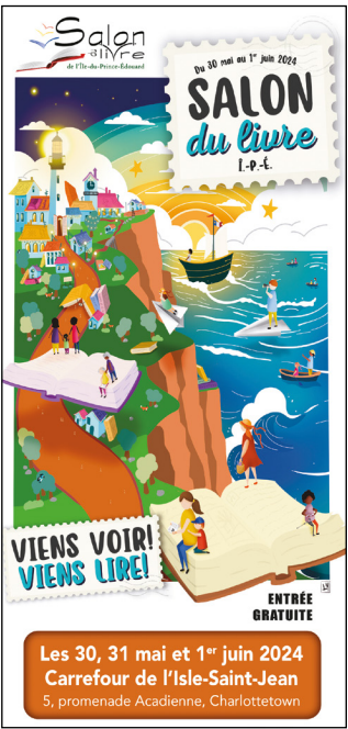
L'ingénieure québécoise en aérospatiale, Farah Alibay, sera la conférencière d'ouverture du Salon du livre de l'ÎPÉ 2024.